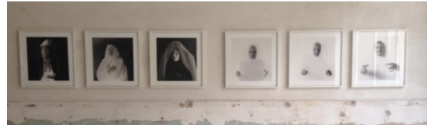
'The veins of my heart' 'The threads of my memory'

Drie beelden: ' Divine Inspiration ' - Goddelijke Inspiratie. Denk aan vurige tongen (Pinksteren). De linkse kop is expressief, vervuld van emotie, begeistert. Een vlam komt uit het derde oog. Of komt hij daar binnen? De middelste kop oogt ascetisch. Bollen van kleur verbeelden het in verbinding staan met de energie van het universum. Dat is voor deze mens het enige dat telt. Maar iedere geest heeft toch een lichaam nodig? Of bestaat er ook bewustzijn los van de materie? Komt daar dan onze inspiratie vandaan? De derde kop, zwart geblakerd. Alsof hij uit de hel komt en het kwaad hem in bezit nam. Is de 'vlammende hand' boven deze kop in staat hem zo te raken dat het kwaad verdwijnt? Op de vloer vijf stukken brood. Je moet ook eten. En je brood verdienen. Het gaat hier dus over het zoeken van een balans tussen het aardse en het hemelse, het materiele en het spirituele..