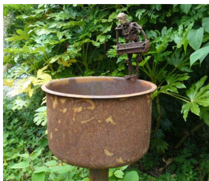
'Should I stay or should I go' - € 1.250,--