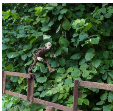
'Jump' - € 1.250,--