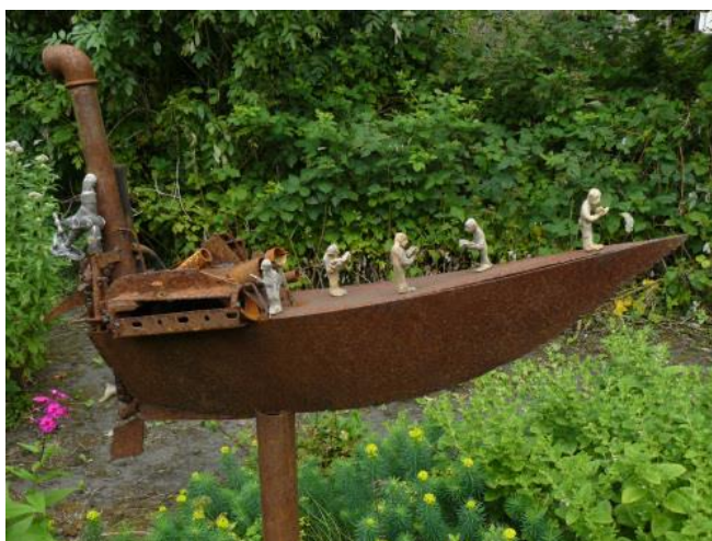
'Boekenboot' - € 1.800,--