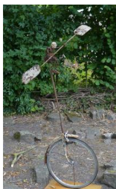
'Luchtvaart' € 1.800,--