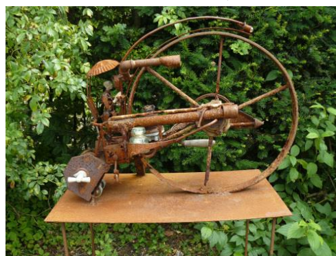
'Vers l'avenir' - € 1.750,--