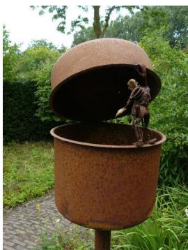
'Kuriezeneuze' € 1.250,--