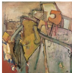
'Chairs and table' € 2.400,--