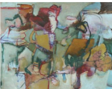
'Make room' - n.t.k.