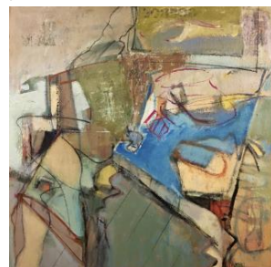
'Otherside' € 3.000,--