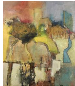
'A certain landscape' € 1.200,--