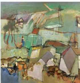
'The growing suburb' € 3.000,--