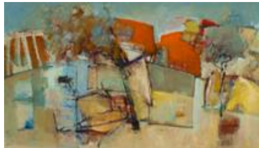
'Le village' € 3.500,--