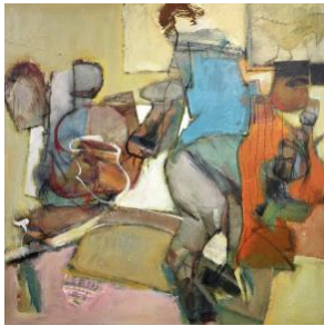
'After all' € 1.800,--