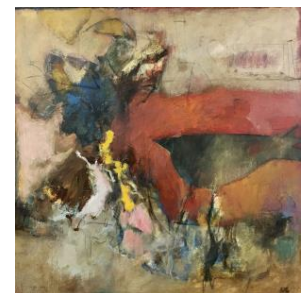
'Inner struggle'- n.t.k.