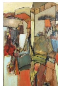
'Urban landscape 11' € 2.100,--