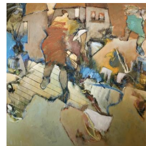
'Final entry' € 4.900,--