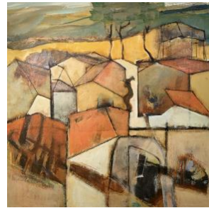
'Urban landscape 15' € 1.800,--