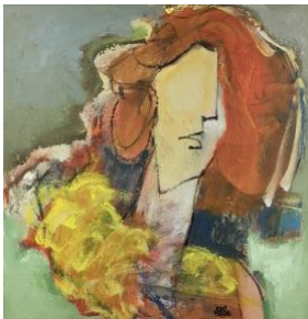
'Portrait 11' € 600,--