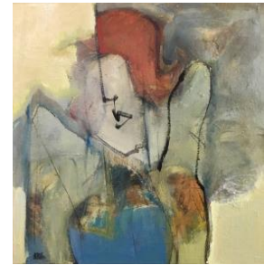
'Portrait 12' € 600,--