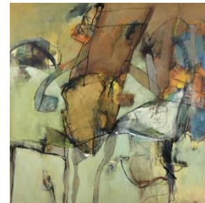
'The chair of monsieur Tarry' - € 3.000,--