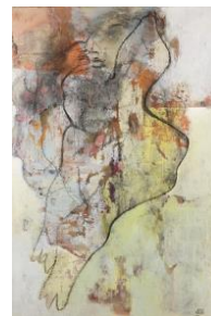
'Dream on' € 2.100,--