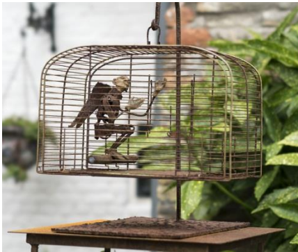
'Verwachte vrijheid' - € 1.250,--