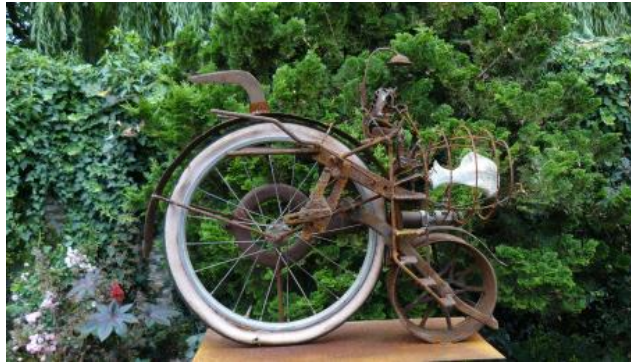
'Bonebike' - € 1.750,--