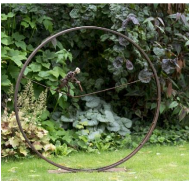
'Overtocht' € 1.500,--