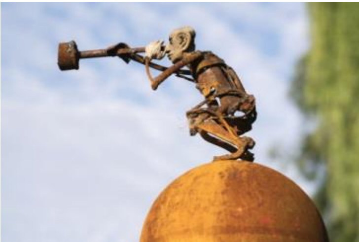
'Met zicht op de toekomst' - € 1.500,--