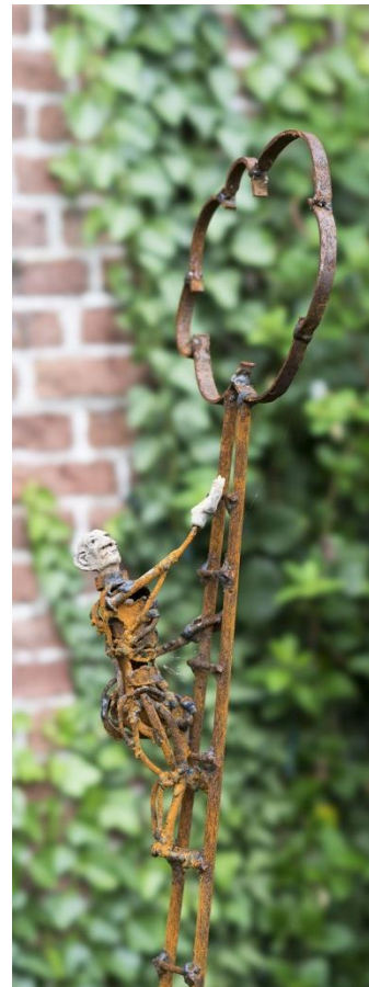
'Bijna in de wolken' € 1.500,--