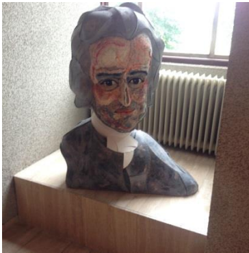
Jean-Jacques Rousseau , Frans filosoof (1712-1778): “Van nature is de mens goed en gelukkig; het is de beschaving die zijn oorspronkelijke geluk verwoest.”