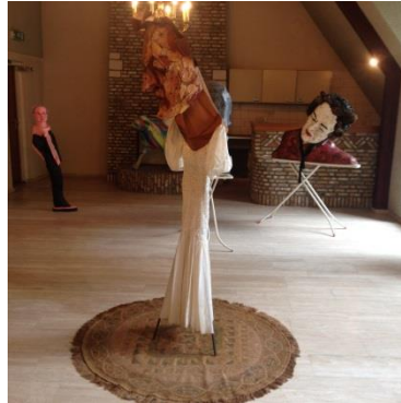
Hélène Cixous , Frans filosofe (1937): “Vrouwen moeten hun eigen geschiedenis schrijven met hun eigen woorden in hun eigen taal.”