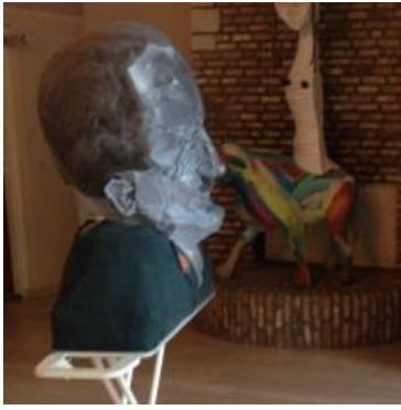
Martin Heidegger , Duits filosoof (1889-1976) – “Technologie is in zijn essentie iets dat de mens niet kan beheersen.” (Heidegger en Arendt hadden enige tijd een relatie).