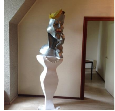
Martha Nussbaum , Amerikaans filosofe (1947): “Een goede samenleving is een samenleving die elk van haar leden in de gelegenheid stelt om zijn capaciteiten te ontplooiën.”