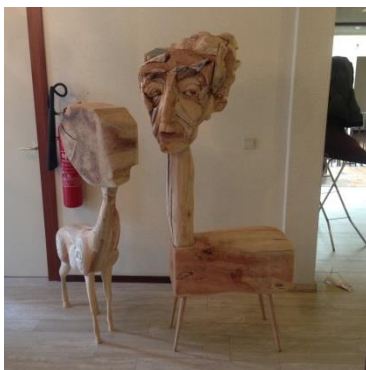
Bernard-Henri Lévy , Frans filosoof (1948), in Franse pers vaak BHL genoemd. Bekend als journalist, activist, filmmaker en societyfiguur. Met zijn vrouw, de actrice Arielle Dombasle , vaak achtervolgd door de media.