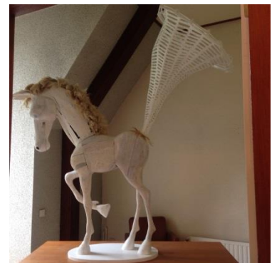
‘Horse of plenty’