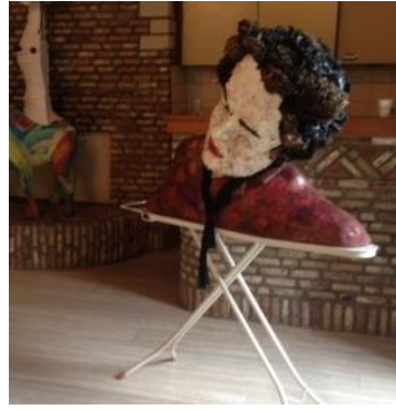
Hannah Arendt , Duits-Amerikaans filosofe (1906-1975) – “Politieke kwesties zijn veel te belangrijk om aan de politici te worden overgelaten.”