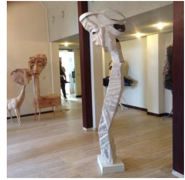
Simone de Beauvoir , Frans filosofe (1908-1986) – “De middelmatigste man voelt zichzelf een halfgod vergeleken met vrouwen.” (De Beauvoir had met Sartre een verhouding, waarin zij voor een deel toch gevangen zat).