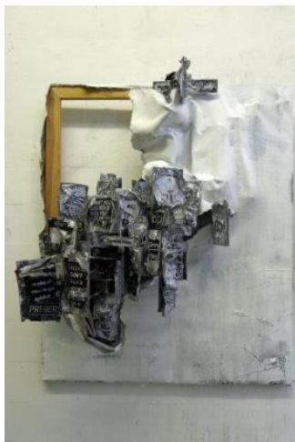
'We follow blindly 03'