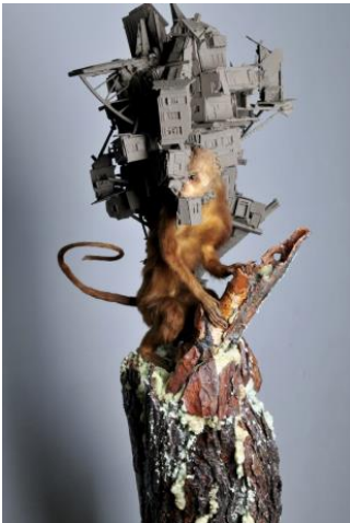
'Multi structure 01'