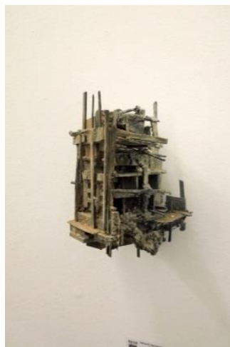
'VEB M-werk 05'