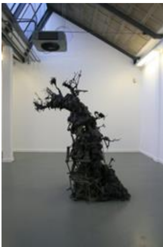
'Indus structure 01'

'We follow blindly 03' en 'Silicon sky 01' gaan over hoe ons beeld van de werkelijkheid ontstaat? Zijn wij vrij in ons denken? Of worden wij gemanipuleerd? Leven wij uiteindelijk toch in een 'Brave new world'?