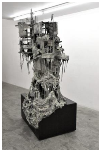
'Mycose city 01'