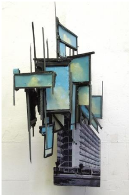
'Silicon sky 01'