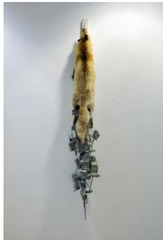
'Intestine city 01'