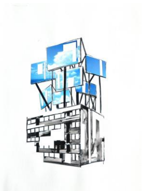
'Sketch silicon sky 01'