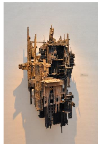
'VEB M-werk 07'