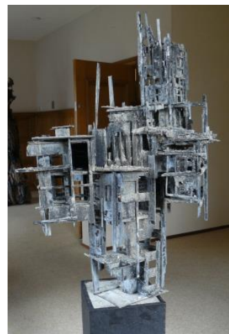
'Silicon sky 03'