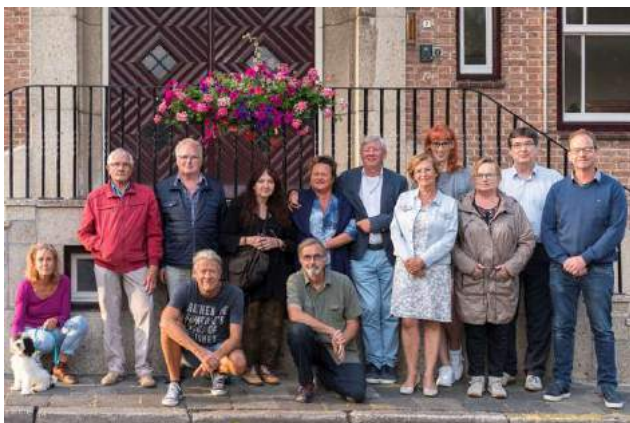
De basisgroep voor het oude stadhuis, één van de Festivallocaties

Medio 2016 waren er signalen dat er in Aardenburg ruimte was voor een nieuw initiatief op cultureel gebied. Een goed moment om samen met zoveel mogelijk Aardenburgers een cultureel evenement te organiseren dat zou kunnen bijdragen aan de leefbaarheid in en de bekendheid van Aardenburg als West Zeeuws-Vlaamse cultuurstad. Op initiatief van Stichting Aardenburg Kunstenfestival, begin 2016 opgericht om invulling te geven aan de wens om Aardenburg als cultuurstad een nog prominentere plek op de kaart te geven, werden de ideeën besproken in een basisgroep bestaande uit diverse cultureel geïnteresseerde inwoners. Zo ontstond al snel een aangename behoefte om samen aan de slag te gaan.