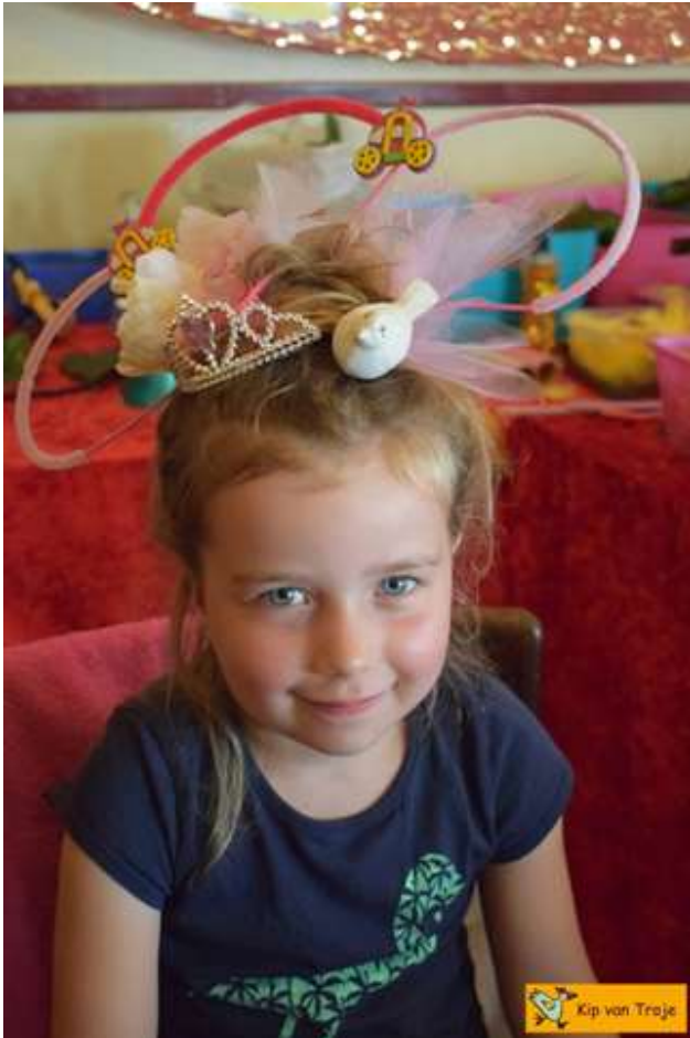
Poëtisch Kapsalon Kip van Troje