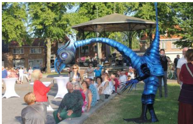
Blauwe vogels luisteren de opening van het kunstenfestival op

op lange nekken bewogen zich in een ritmische pas in de richting van het verraste publiek. In de vogelpakken zaten leden van de theatergroep CloseAct. De oh's en ah's waren niet van de lucht.