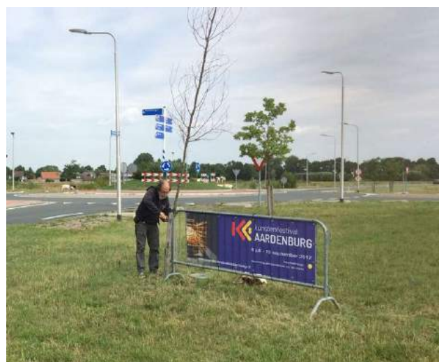
Eén van de vrijwilligers plaatst een banner aan de rand van Aardenburg

begrote 3000 bezoekers wilden halen zouden er gemiddeld toch zo'n 60 bezoekers per dag moeten komen. En hoe zouden die oordelen over ons kunstenfestival?